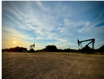
Petróleo en Santander: ¿cómo va la producción y cuál es su potencial?

En el primer trimestre del año, Santander tuvo su peor arranque de producción petrolera en los últimos años. De acuerdo con los datos de la Agencia Nacional de Hidrocarburos, ANH, el departamento tuvo una producción promedio de 40.580 barriles diarios de crudo entre enero y marzo de este año. Lea también: Producción petrolera de Santander tuvo su peor arranque en los últimos años