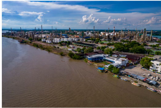
Refinería de Barrancabermeja arrancó el año con resultado positivo, pero aumenta importación de crudos livianos