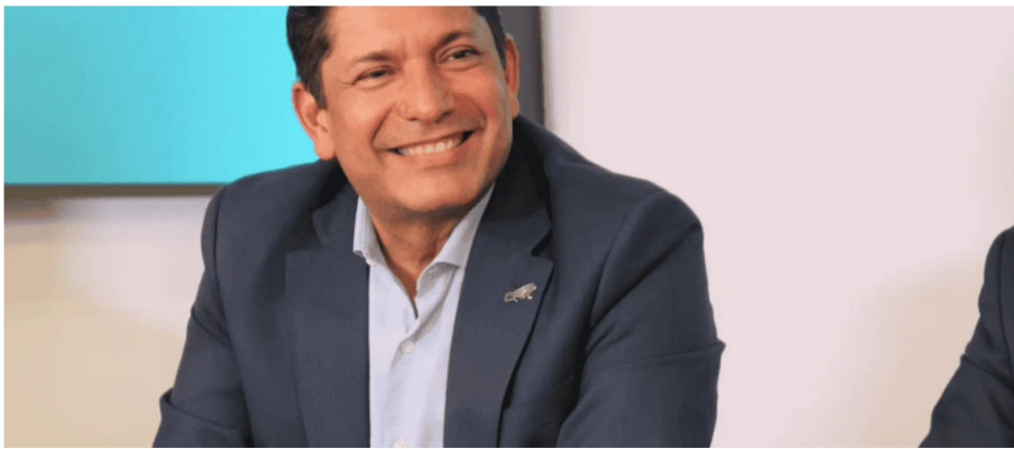
Juan Carlos Hurtado, presidente encargado de Ecopetrol.

El costo de levantamiento es el costo asociado a todas las actividades operacionales, que tiene unos costos de energía, unos costos de química, unos costos de intervención de pozos.