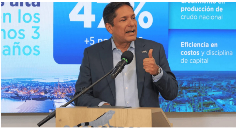
Juan Carlos Hurtado, presidente encargado de Ecopetrol.