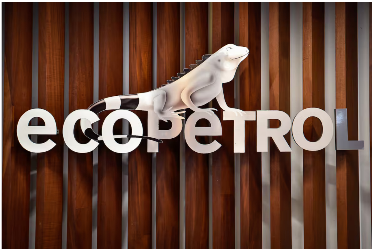
Imagen de referencia del logo de Ecopetrol.

Redacción Economía 13 MAY 2026 - 08:19 AM