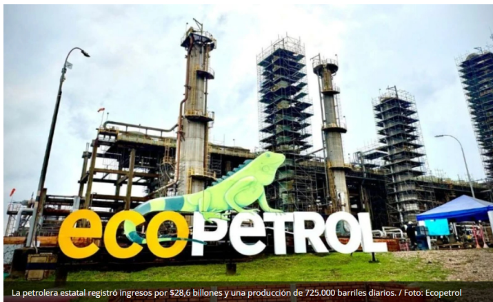
La petrolera estatal registró ingresos por $28,6 billones y una producción de 725.000 barriles diarios.

Bogotá – Ecopetrol presentó sus resultados financieros del primer trimestre de 2026, reportando utilidades por $2,8 billones e ingresos consolidados de $28,6 billones.