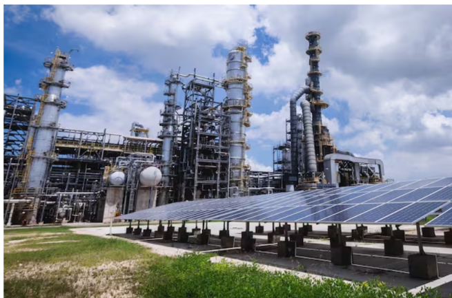
En 2023 el Permian representaba el 9 %, en 2024 subió al 12 % y en 2025 alcanzó casi el 14 %/Ecopetrol.

A la caída de las utilidades, expertos advierten que por nada del mundo se debe vender el Permian, como quiere el Gobierno, porque eso sería renunciar a 100.000 barriles diarios