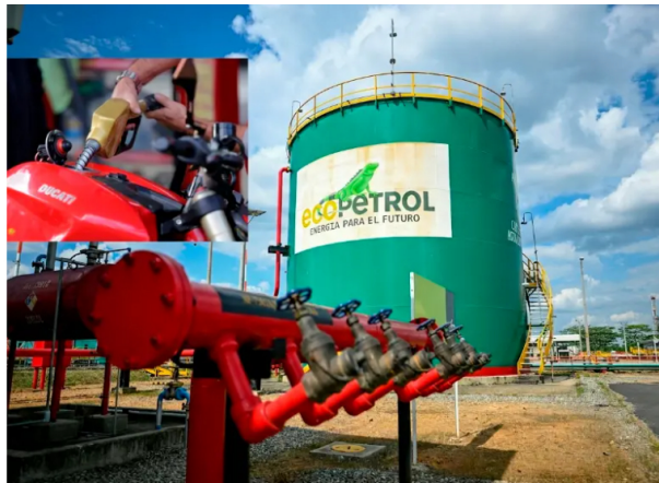
Ecopetrol reportó que la deuda acumulada del FEPC llegó a $4,2 billones al cierre de marzo de 2026.

La deuda del FEPC con Ecopetrol llegó a $4,2 billones en marzo, mientras gasolina y diésel retomaron fuertes alzas por tensión petrolera global este año