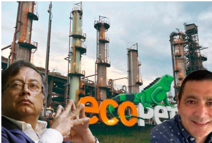
“Fue orden de Palacio”: salida de miembro de la junta directiva de Ecopetrol sería represalia del Gobierno Petro