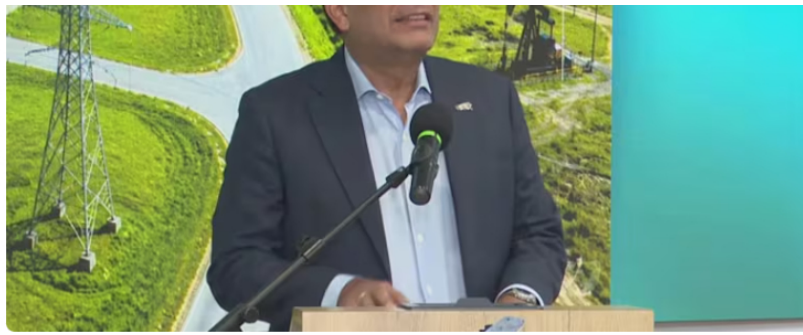
Juan Carlos Hurtado, presidente (e) de Ecopetrol .

El interrogante que flota en el ambiente es si hay un cambio de chip, pues el Gobierno Petro no es partidario de pararle el pedal a negocios con hidrocarburos, en medio de una apuesta por la transición energética hacia otras fuentes más amigables con el medioambiente.