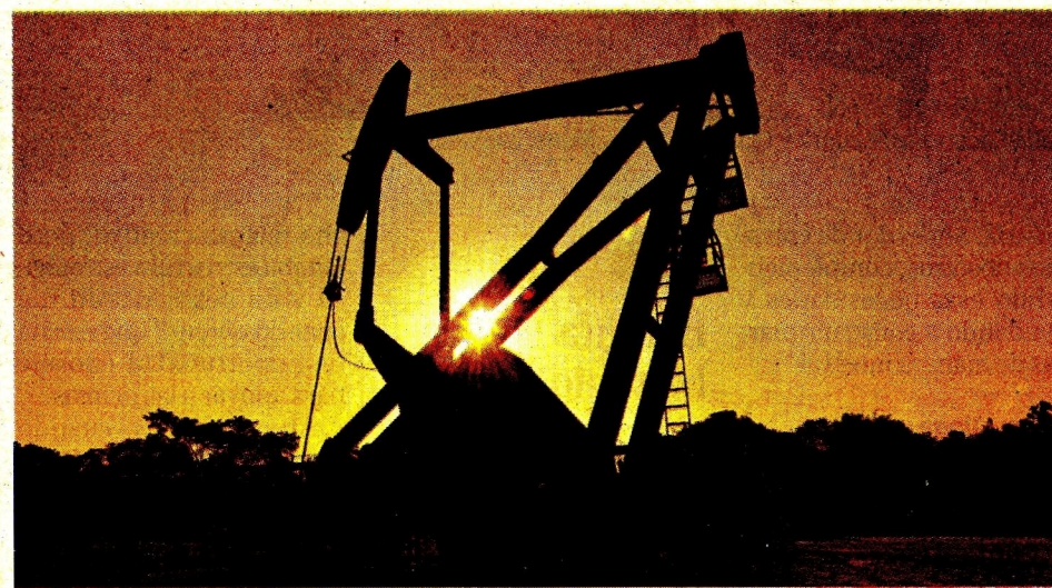
La producción consolidada fue de 725.200 barriles de petróleo equivalente por día.

margen bruto de refinación integrado llegó a US$17,3 por barril, 60% más alto que un año atrás.