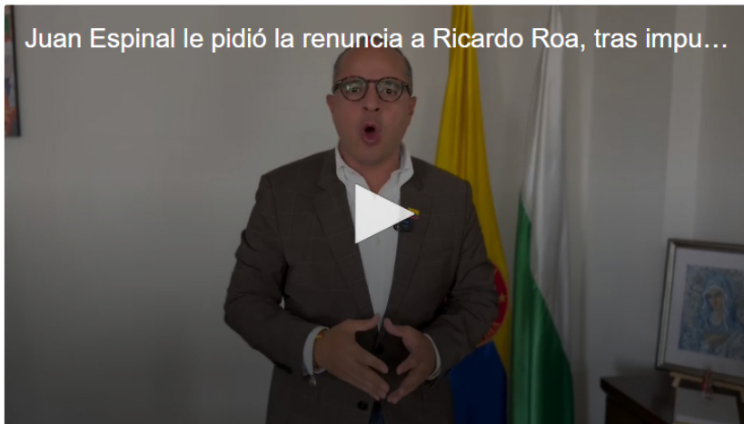
El congresista del Centro Democrático recordó las declaraciones del presidente de Ecopetrol en el legislativo en las que anunció que se haría a un lado si su permanencia en el cargo representaba un riesgo para la estatal petrolera