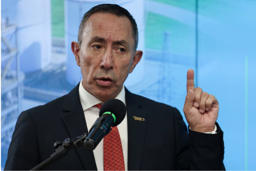
Ricardo Roa, presidente de Ecopetrol , ofició como gerente de la campaña de Gustavo Petro en las contiendas presidenciales de 2022

imputaciones formales de la Fiscalía General de la Nación por violación de topes electorales, en el caso ya mencionado referente a la aspiración del hoy jefe de Estado; y, además, por el presunto tráfico de influencias, tras la compra de un lujoso apartamento en Bogotá.