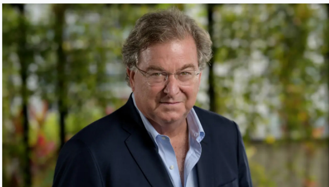
Jaime Gilinski, CEO de Grupo Nutresa.