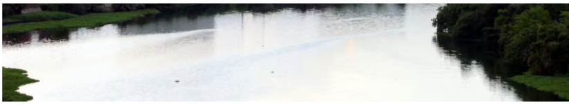
Vista parcial de la Refinería de Barrancabermeja (Santander), de Ecopetrol.