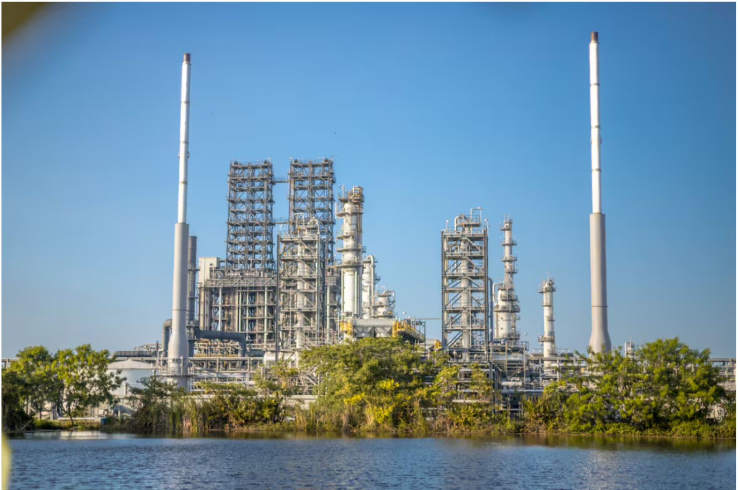
Refinería de Cartagena, en Mamonal, de propiedad de Ecopetrol . //Foto Archivo -EU.

Redacción Economía 12 MAY 2026 - 10:33 PM