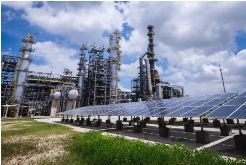
Refinería de Cartagena, propiedad de Ecopetrol.

- Transporte: Desempeño sólido apoyado en eficiencia operativa y mayor captura de volúmenes. Se transportaron 1 millón 122 mil barriles por día (+3% versus 1T25), gracias a la incorporación de volúmenes de terceros (+26 mil barriles por día) y la implementación de la bidireccionalidad del oleoducto Coveñas-Ayacucho, que permitió la importación de aproximadamente 18 mil barriles por día de crudo hacia la refinería de Barrancabermeja.