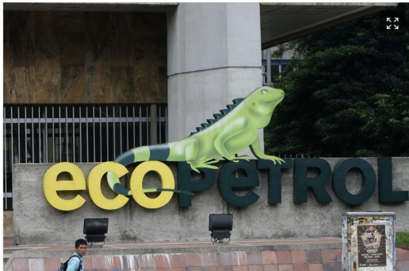
📷 Fotografía de archivo de una vista general del logo de la petrolera estatal colombiana Ecopetrol , en Bogotá (Colombia).

Actualizada el martes, 12 de mayo 2026 | 7:57 pm