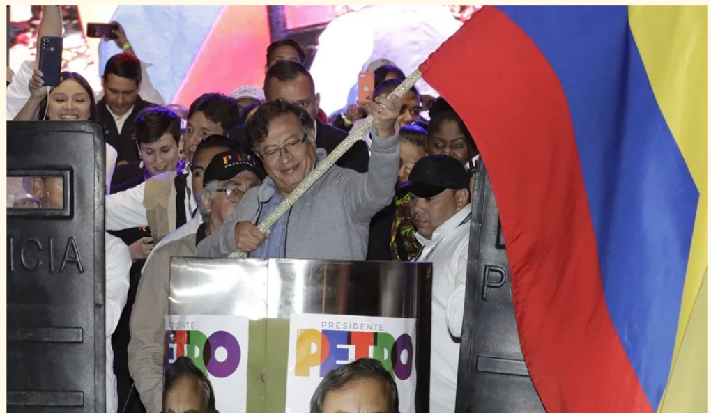
Fotografía de archivo del 22 de mayo de 2022 del hoy presidente de Colombia, Gustavo Petro (c), durante un evento de campaña, en Bogotá (Colombia).

Según el CNE, la campaña de Petro excedió los límites de financiación en primera y segunda vuelta en más de 3.500 millones de pesos (unos 931.000 dólares de hoy) y recibió aportes prohibidos.