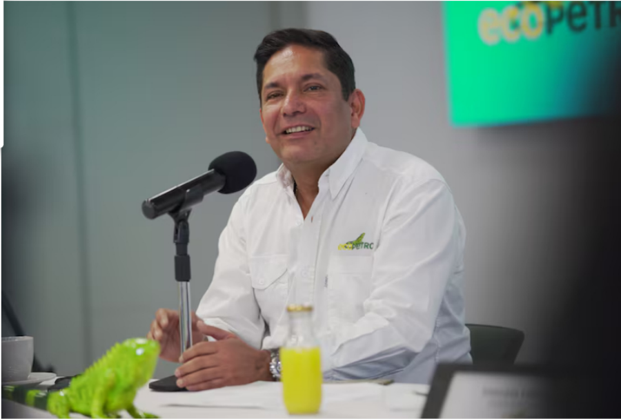
Utilidades de Ecopetrol siguen cayendo: en el primer trimestre bajaron otro 7,7%. De acuerdo con el balance trimestral presentado por la petrolera de mayoría estatal, las ganancias del trimestre fueron de COP$2,8 billones, un 7,7% por debajo de los COP$3,1 billones ganó en el mismo periodo del 2025.

Por Daniel Guerrero | 12 de mayo, 2026 | 04:13 PM