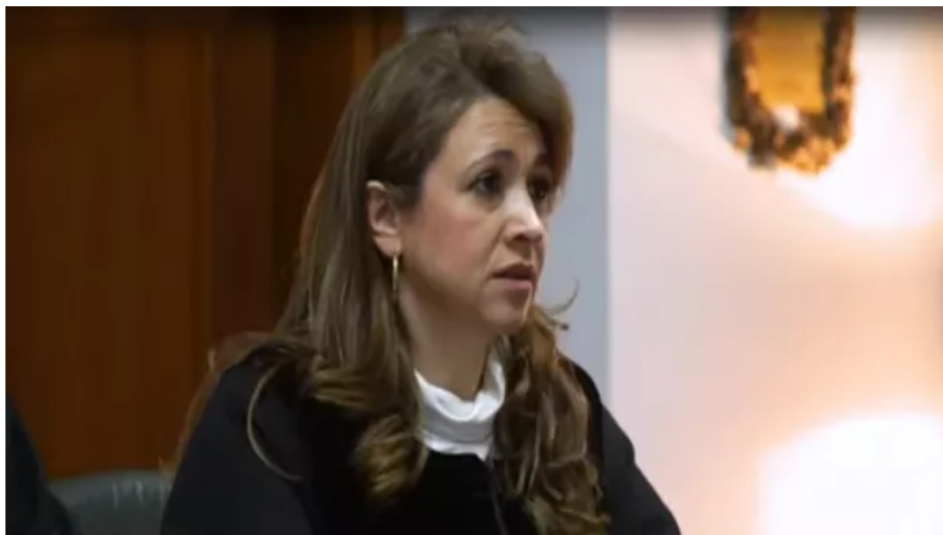
Magistrada Cristina Lombana pide declarar presencialmente en proceso contra Benedetti por insultos