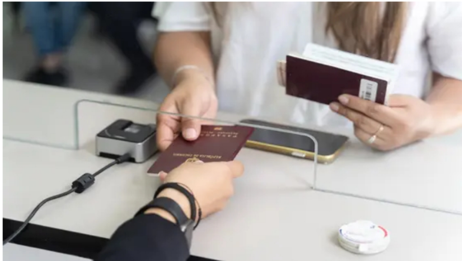
Consejo de Estado tumba trámite que buscaba frenar nuevo modelo de pasaportes en Colombia