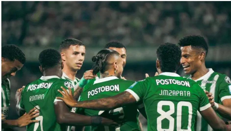
Liga Betplay: Nacional arrasa 7-1 y avanza a semifinales