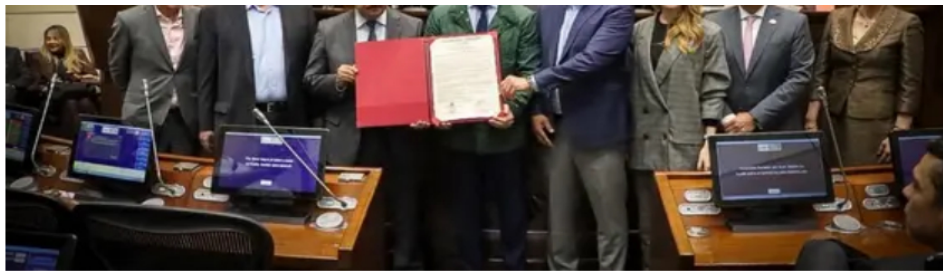
Senado rinde homenaje a Germán Vargas Lleras y decreta tres días de duelo