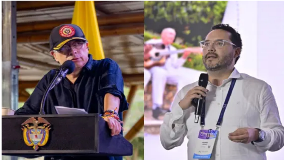
Petro llama "ladrón" al director de Asofondos y anuncia denuncia por fallo sobre pensiones