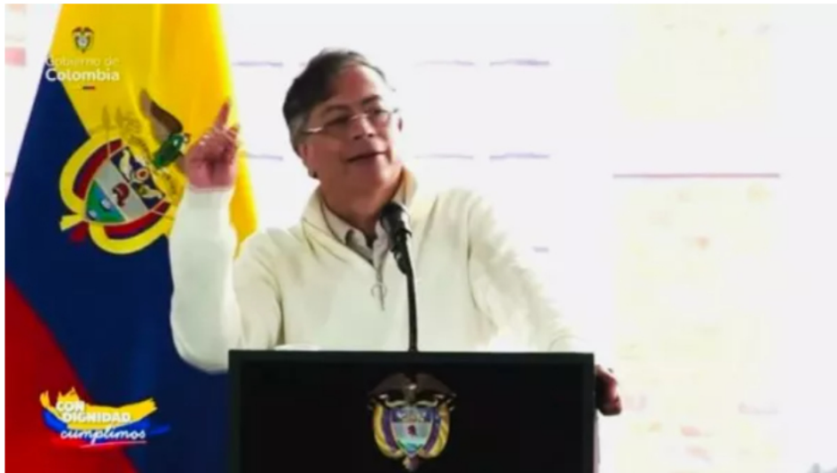
Petro responde a pedido de protección judicial y pide a superfinanciero investigación