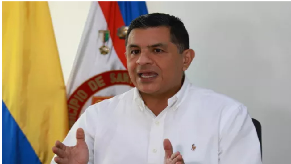
“La renuncia mía me la pide es Petro”, Jorge Iván Ospina responde a Daniel Quintero