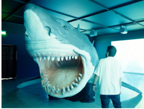
Manifiesto Megalodón: La muestra artística y ambiental que llega a Medellín