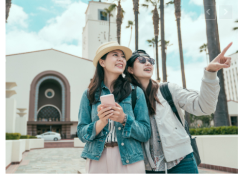
Turismo extranjero en Colombia crece 4,4 % impulsado por las nuevas generaciones