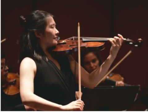
Virtuosos de la música clásica se unen en Medellín por La Casita de Nicolás