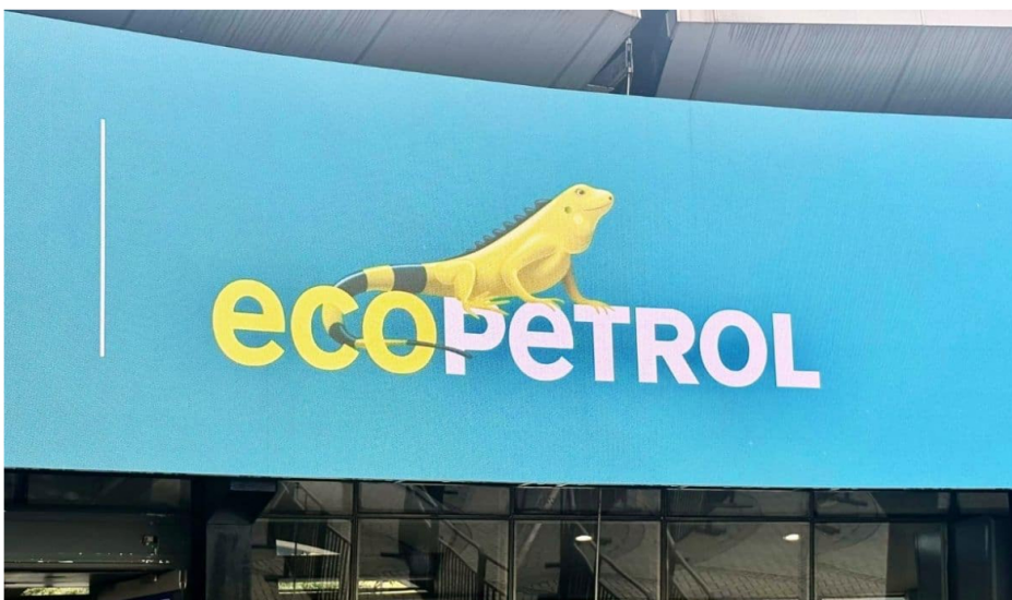
Ecopetrol.