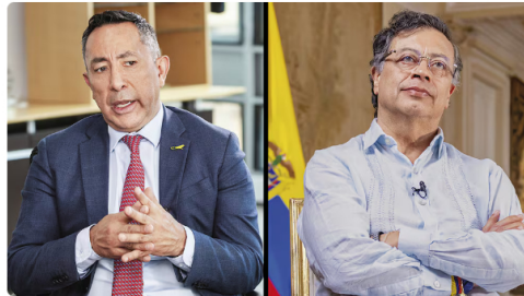
Gustavo Petro insiste en respaldar a Ricardo Roa, pero la decisión del CNE más la imputación en su contra por parte de la Fiscalía lo ponen en serios aprietos.

"Se habrían ejecutado gastos por 770.148.964 que no fueron reportados a Cuentas Claras. Una vez se hacen estas operaciones, pues no solamente excede, sino que se observa que esos gastos no fueron reportados en su totalidad, en este caso, pese a corresponder a pagos por servicios y apoyos efectivamente destinados a la campaña presidencial Petro Presidente", dijo el fiscal.