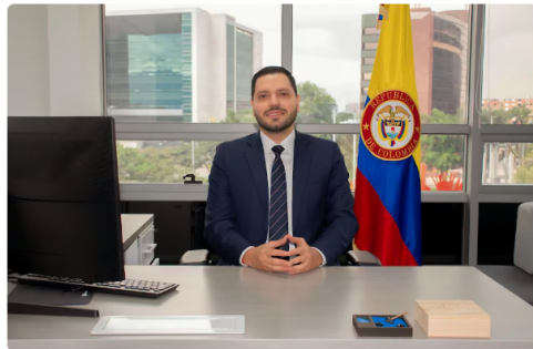
Juan Camilo Zuluaga Morillo, Contralor de Bogotá.

Los retrasos habrían impactado negativamente el desarrollo del proyecto, añadió la Contraloría. "Para ese momento, solo se habían construido siete de las 41 cimentaciones previstas y no se encontraban instalados los aerogeneradores necesarios para su funcionamiento".