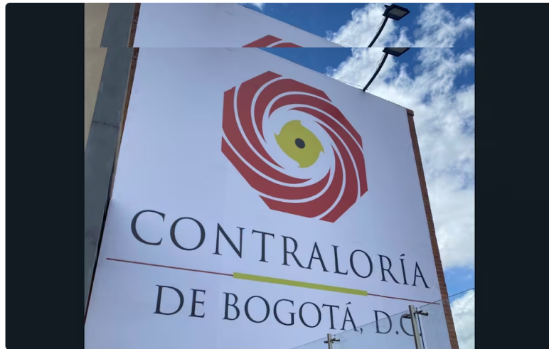
Contraloría de Bogotá abre procesos por presunto detrimento superior a los 313.000 millones de pesos.

La Contraloría de Bogotá abrió un proceso de posible responsabilidad fiscal tras varios hallazgos luego de una investigación que adelantó sobre un proyecto que involucra a Enel Colomba.