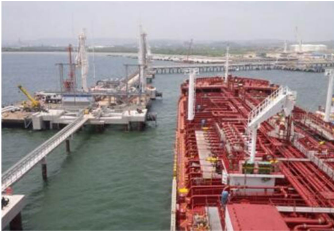
26 de agosto 2015. Cartagena. El presidente Juan Manuel Santos, inauguró el Puerto Bahía en Cartagena.

Ecopetrol alcanzó un nuevo hito operativo al completar la exportación de un cargamento único de 500.000 barriles de fuel oil desde el terminal marítimo de Puerto Bahía. Esta operación representa un récord para la compañía al duplicar su capacidad de exportación en un solo embarque y elevar la tasa de cargue a 30.000 barriles por hora, optimizando significativamente los tiempos y los costos logísticos de la estatal petrolera.