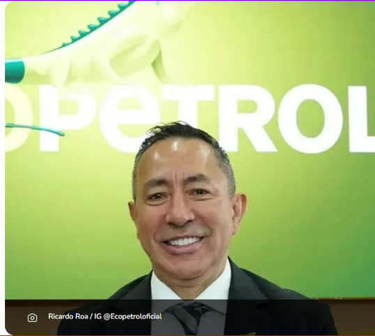
Ricardo Roa / IG @Ecopetroloficial