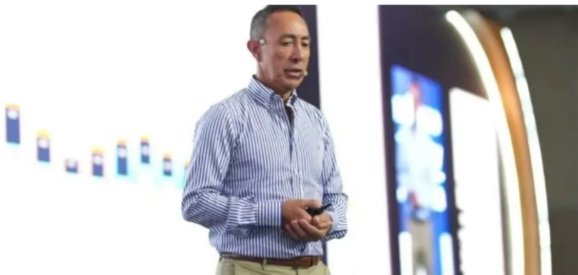
Ricardo Roa, presidente de Ecopetrol.

Tiene otro expediente abierto por el presunto delito de tráfico de influencias.