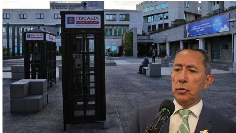
Presidente de Ecopetrol Ricardo Roa a responder en imputación de la Fiscalía General

El juez 35 de control de garantías de Bogotá avaló la imputación formulada por parte de la Fiscalía contra el presidente de Ecopetrol, Ricardo Roa, por su supuesta responsabilidad en la violación de los topes de la campaña del presidente Gustavo Petro en el año 2022.