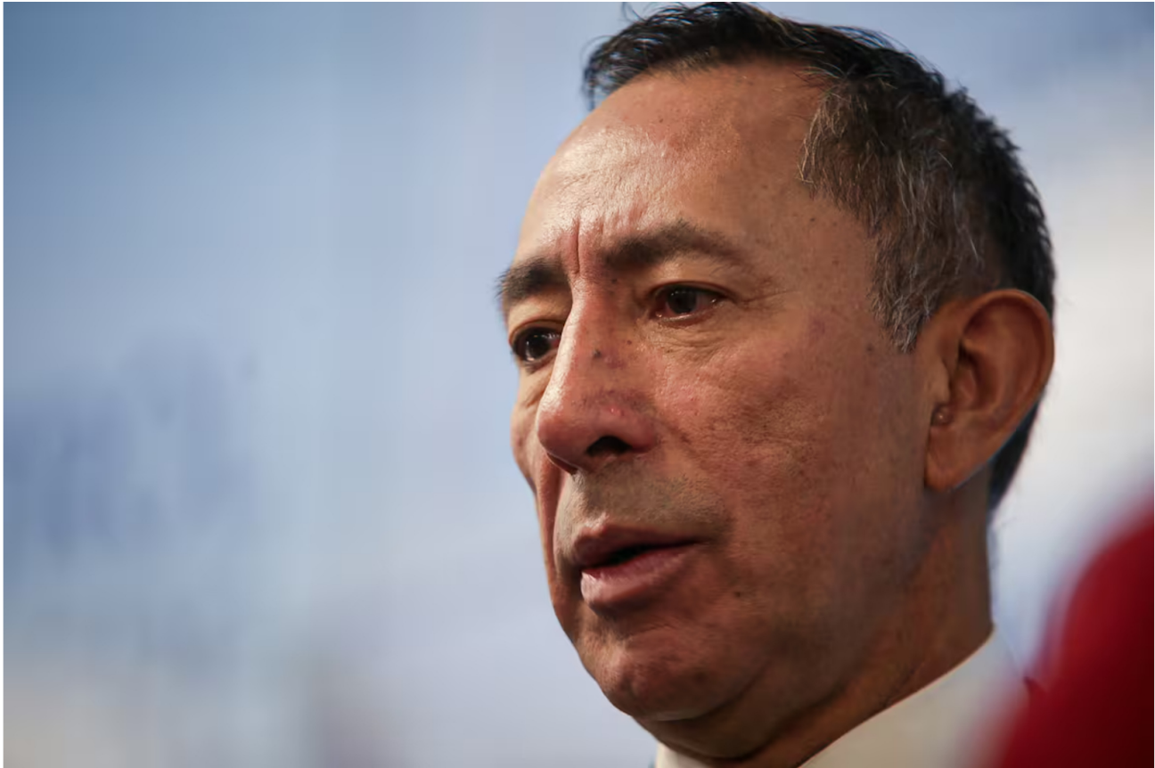
El presidente de Ecopetrol, Ricardo Roa Barragán.

EL UNIVERSAL Y COLPRENSA 11 MAY 2026 - 06:45 PM