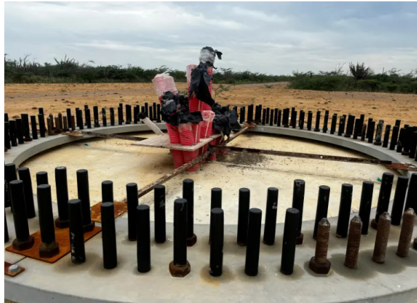
El proyecto eólico Windpeshi permanece suspendido desde mayo de 2023 sin entrar en operación comercial.

La Contraloría de Bogotá investiga presunto detrimento de $313.276 millones en proyecto eólico Windpeshi, ubicado en La Guajira, suspendido desde 2023 y sin entrar todavía en operación comercial.