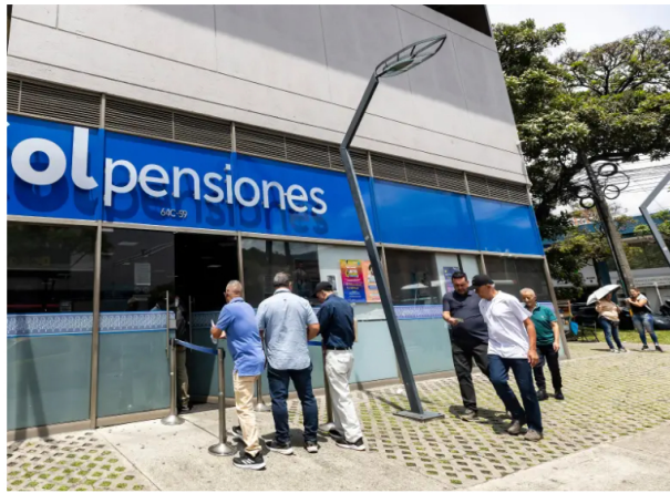
El Gobierno Nacional advirtió que la suspensión del Decreto 415 de 2026 podría afectar la sostenibilidad financiera del sistema pensional y el traslado de recursos a Colpensiones.