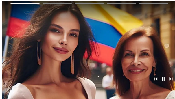
Enlaces Promovidos por Taboola

Por esta razón, el proceso de responsabilidad fiscal buscará establecer si hubo fallas en la toma de decisiones , así como identificar a las personas que intervinieron en la planeación y ejecución del proyecto.