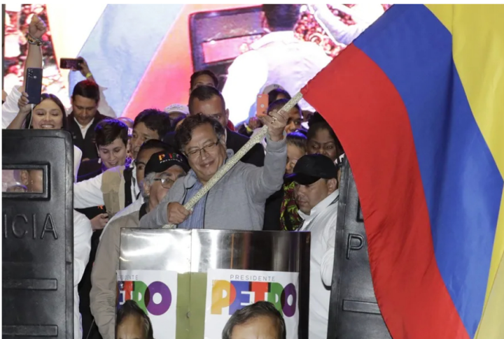
Fotografía de archivo del ex presidente de Colombia, Gustavo Petro, (el) durante un evento de campaña en Bogotá (Colombia).

Según el CNE, la campaña de Petro excedió los límites de financiación en primera y segunda vuelta en más de 3.500 millones de pesos (unos 931.000 dólares de hoy) y recibió aportes prohibidos.