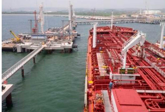
26 de agosto 2015. Cartagena. El presidente Juan Manuel Santos, inauguró el Puerto Bahía en Cartagena. (Colprensa - El Universal).