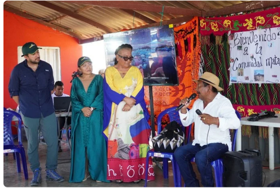
Windpeshi contará con 41 aerogeneradores y una capacidad de 205 MW, convirtiéndose en el primer parque eólico operado por Ecopetrol.

El argumento central del organismo de control es que se comprometieron recursos significativos sin que el proyecto cumpliera, hasta ese momento, el propósito para el cual fue concebido. Como el Distrito Capital tiene participación en Enel Colombia S.A. E.S.P., la Contraloría considera que hubo una presunta afectación a recursos públicos distritales, lo que le da competencia para indagar quiénes intervinieron en la planeación, ejecución y toma de decisiones del proyecto.