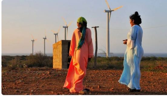
Mujeres wayuu observan los aerogeneradores instalados en La Guajira, epicentro de los proyectos eólicos que avanzan en el norte del país.

“Hasta ahora hemos encontrado lo que es evidente: el Parque Eólico Windpeshi, con una inversión de más de 1 billón de pesos por parte de Enel Colombia, no ha generado un kilovatio de energía. Esto qué quiere decir: que la inversión de los recursos públicos no ha cumplido con su finalidad ”, dijo en su momento.