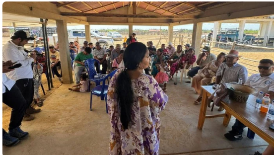
Ecopetrol avanza en el proceso de diálogo con comunidades wayuu para concertar la reactivación del proyecto eólico Windpeshi.

A lo largo del segundo semestre de 2025, Ecopetrol reportó progresos en el componente que históricamente había frenado el proyecto: el relacionamiento con las comunidades. En noviembre, la compañía informó que los acuerdos de consulta previa, tanto del parque eólico como de su línea de transmisión, superaban el 90 por ciento de avance, con la participación de 30 comunidades certificadas en el área de influencia.