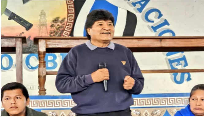
Tribunal de Bolivia declara en rebeldía a Evo Morales y ordena su captura por caso de trata de personas