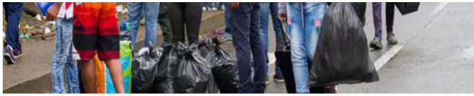
Colombia, segundo país del mundo con más desplazados internos en 2025