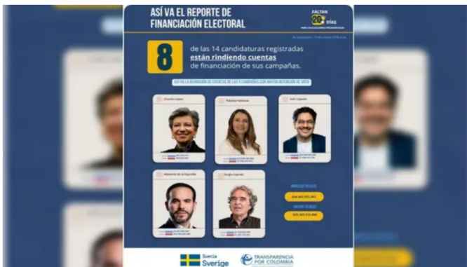
Ocho campañas presidenciales reportan sus cuentas: créditos bancarios concentran el 96,4% de los ingresos