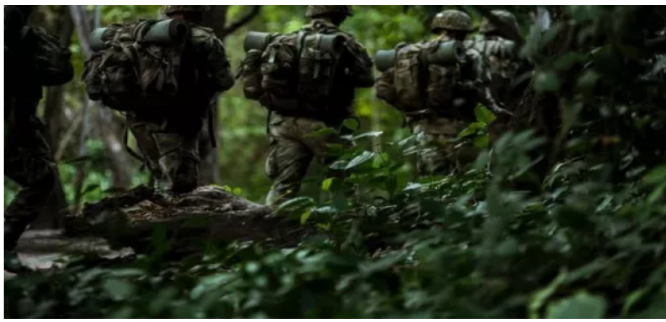
Ejército localiza a los 64 militares que permanecían incomunicados en la selva del Guaviare