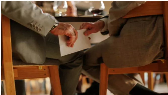
Corrupción judicial: condenan a exmagistrados que vendieron decisiones judiciales