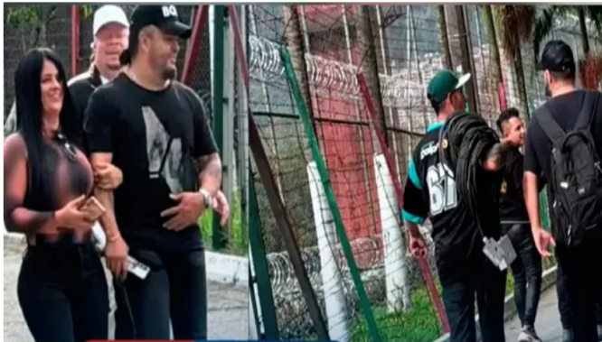
Parranda en cárcel de Itagüí: un mes después solo han trasladado a un cabecilla suplente