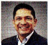
JUAN CARLOS HURTADO PRESIDENTE (E) DE ECOPETROL

La compañía presentará sus resultados financieros con corte al primer trimestre del año. El mercado espera que los ingresos rondan entre $27 y $30 billones. Las cifras serán claves para medir el rendimiento de la empresa tras la caída de las utilidades en periodos previos.