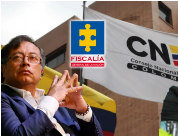
El presidente Gustavo Petro.

Para la Fiscalía, Roa tendría que haber estado enterado de los parámetros que para esa contienda había fijado el CNE en materia de gastos, a través de la Resolución 0694 de 2022.