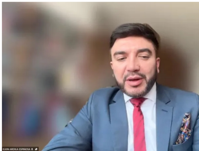
Elkin Ardila, fiscal.

Las cuentas que tiene el fiscal Ardila en su despacho parten de que la campaña Petro habría ejecutado gastos reales en primera vuelta por un valor de 29.924 millones de pesos , suma que superó el límite máximo de 28.536 millones. El exceso sería de 1.388 millones de pesos.