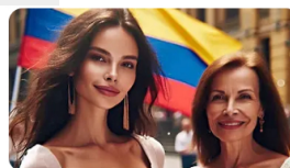
Una aplicación que utiliza inteligencia artificial para ganar dinero ha sido lanzada ...