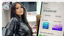
Empieza a ganar un segundo sueldo con CFD de Bancolombia

COLOMBIA RICARDO ROA CAMPAÑA PETRO PRESIDENTE