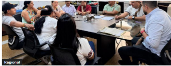
Realizan seguimiento a compromisos viales con comunidades indígenas del CRIHU