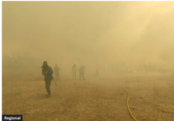
Amenaza de incendios y déficit hídrico: CAM activa planes de contingencia en todo el departamento