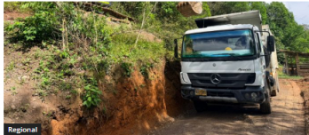
Emergencia vial en el Huila: lluvias afectan al 78% de los municipios del departamento