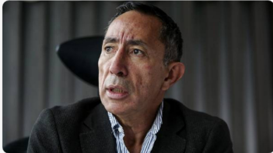
Ricardo Roa, presidente de Ecopetrol.

PODER • Publicado el 8 de mayo de 2026 a las 3:29 pm