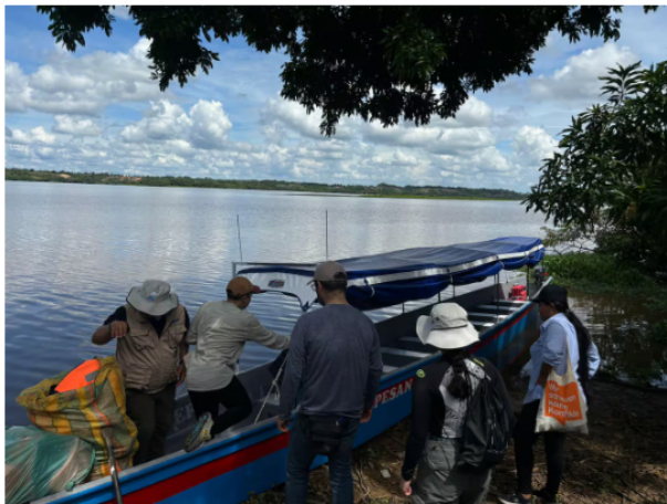
La Acción Popular que dio cabida al fallo del Tribunal Administrativo de Santander fue interpuesta por la Federación de Pescadores, Fedepesan.

La corporación judicial también aclaró que las órdenes impartidas no representan una sanción contra las entidades vinculadas al proceso.