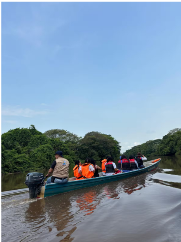
La Acción Popular que dio cabida al fallo del Tribunal Administrativo de Santander fue interpuesta por la Federación de Pescadores, Fedepesan.

“Necesitamos laboratorios realmente reconocidos y responsables. Queremos que las comunidades de pescadores podamos tener confianza en los resultados y que esto no se convierta simplemente en algo que oculte las realidades que se viven en el caño Rosario. Todos estos últimos años hemos visto la problemática de la muerte de la fauna en este lugar y por eso exigimos estudios serios”, sostuvo.