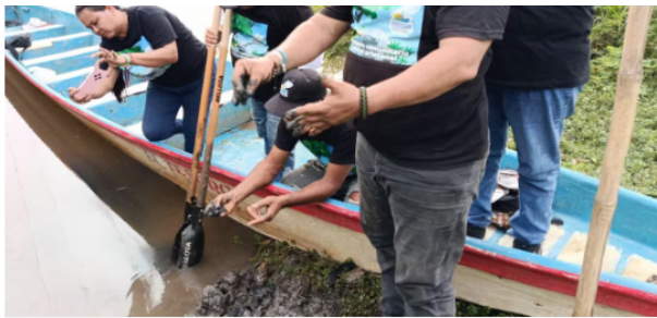
La Acción Popular que dio cabida al fallo del Tribunal Administrativo de Santander fue interpuesta por la Federación de Pescadores, Fedepesan.

Con la decisión, el Tribunal mantuvo el orden para que la CAS, el Distrito de Barrancabermeja, Aguas de Barrancabermeja y Ecopetrol realicen estudios fisicoquímicos, microbiológicos y de sedimentos en el caño El Rosario, con el fin de identificar los agentes contaminantes presentes en el afluente y determinar el origen de las afectaciones ambientales.