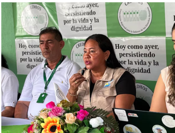
La Acción Popular que dio cabida al fallo del Tribunal Administrativo de Santander fue interpuesta por la Federación de Pescadores, Fedepesan.

“Nosotros en ningún momento accionamos directamente contra Ecopetrol . La acción popular iba dirigida a la Alcaldía, Aguas de Barrancabermeja y la CAS. Fue dentro del proceso y de las pruebas que se decidió vincular a Ecopetrol . Lo que buscamos es la protección de los derechos ambientales y recuperar el caño Rosario”, afirmó.