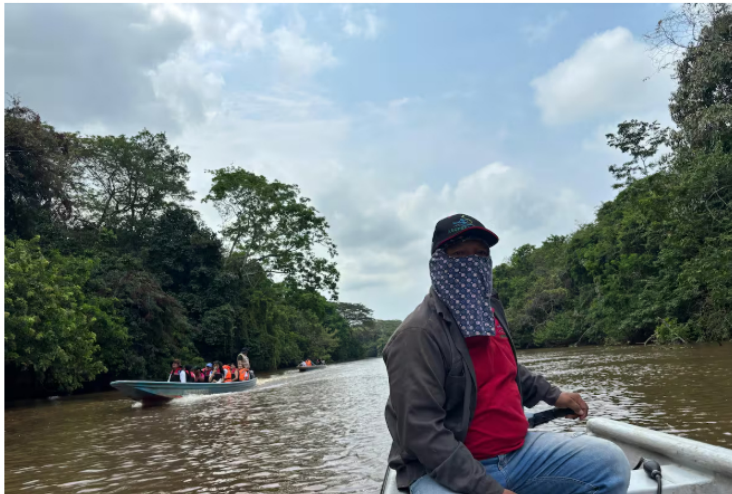
La Acción Popular que dio cabida al fallo del Tribunal Administrativo de Santander fue interpuesta por la Federación de Pescadores, Fedepesan.

Siga las noticias de Vanguardia en Google Discover