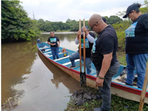
La Acción Popular que dio cabida al fallo del Tribunal Administrativo de Santander fue interpuesta por la Federación de Pescadores, Fedepesan.