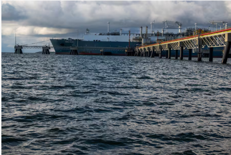
La terminal de regasificación de Cartagena. Imagen de referencia.