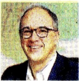
JUAN CARLOS ECHEVERRY PTE. DEL BANCO DE BOGOTÁ

Asumió oficialmente la presidencia del Banco de Bogotá , una de las entidades financieras más importantes del país. Su llegada marca una nueva etapa que está respaldada por su amplia trayectoria como exministro de Hacienda y expresidente de Ecopetrol .