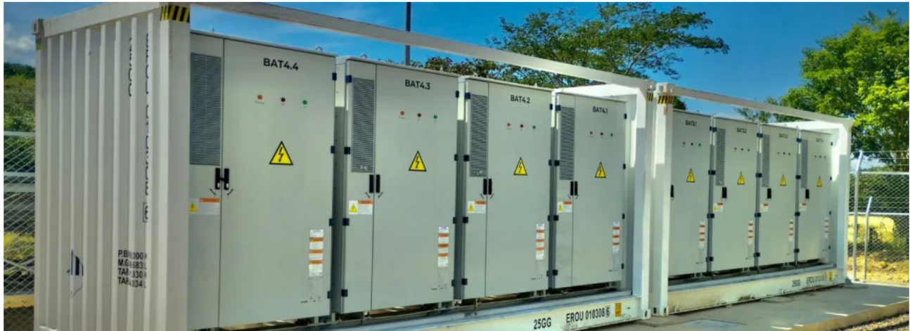
Foto: El grupo proyecta incorporar 931 megavatios adicionales que cubrirían el 80% de su demanda energética en Colombia.