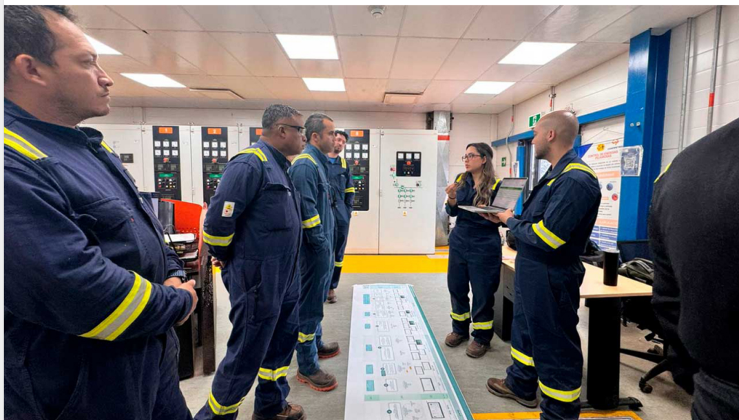
Grupo Ecopetrol creó su propio 'Cerebro Energético' para optimizar la gestión de sus operaciones con inteligencia artificial