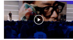
Meta Presenta sus Nuevas Gafas Inteligentes con Control Neural