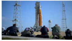
Misión tripulada Artemis II inicia cuenta regresiva oficial