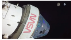
Cápsula Orion lidera misiones hacia la órbita lunar