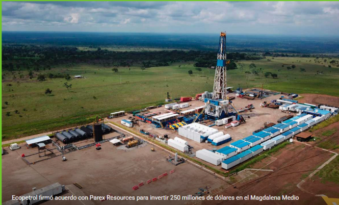
Ecopetrol firmó acuerdo con Parex Resources para invertir 250 millones de dólares en el Magdalena Medio