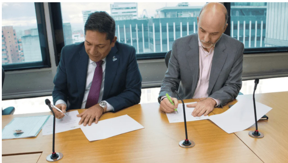
Ecopetrol y Parex firman acuerdo de colaboración.

Por: Jessika Paola Rodríguez Mendoza - 2026-05-04