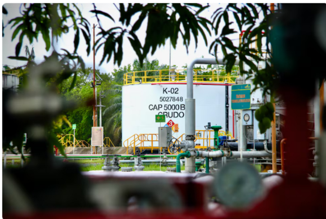
Campos que hacen parte del acuerdo entre Ecopetrol y Parex Resources.

Según Ecopetrol , este modelo permitirá atraer capital e incorporar tecnologías avanzadas, al tiempo que fortalece la capacidad de ambas compañías para maximizar el valor de los activos y aumentar las reservas.