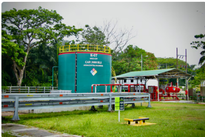
La inversión fue de 250 millones de dólares.

El plan de trabajo incluye iniciativas de recobro mejorado, perforación infill y optimización de inyección de agua, estrategias clave para aumentar la eficiencia y prolongar la vida útil de campos maduros.