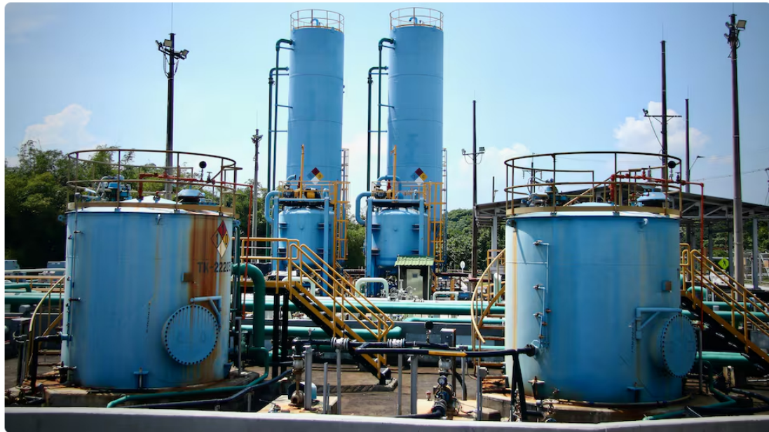
Campos que hacen parte del acuerdo entre Ecopetrol y Parex Resources.

Ecopetrol anunció la firma de un acuerdo de colaboración empresarial con Parex Resources para el desarrollo conjunto de varios campos petroleros en la región del Magdalena Medio, con una inversión estimada de 250 millones de dólares.