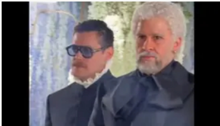
Met Gala 2026: los mejores vestidos que deslumbraron en la alfombra roja