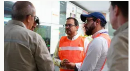
Superservicios inicia evaluación integral a EPM