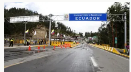
Ecuador rebaja el arancel a productos colombianos del 100% al 75%