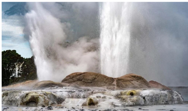
Energía geotérmica.

Comisión de Regulación de Energía y Gas (CREG) se conocieron algunos detalles sobre el desarrollo de esta fuente.