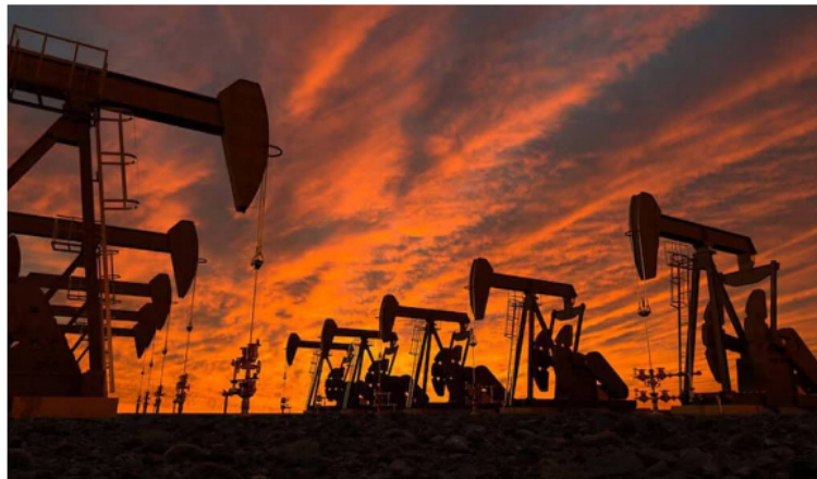
Sector petrolero.

 lvarez tambi n indic  que las empresas operadoras de hidrocarburos, como Ecopetrol o incluso GeoPark, pueden contribuir al desarrollo de esta fuente. Seg n explic , los hidrocarburos est n llamados a potenciar la geotermia.