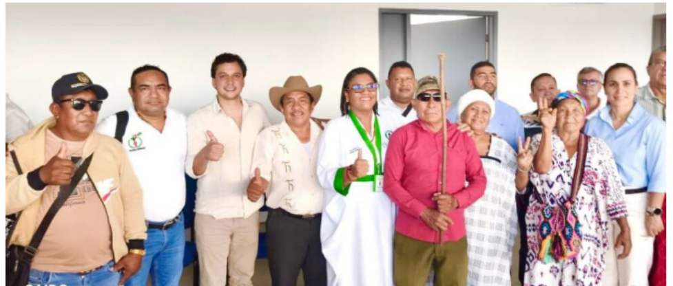
La Gobernación de La Guajira abrió una ruta institucional para atender las inquietudes relacionadas con el uso del camino ancestral hacia Windpeshi.

Durante el encuentro, los actores presentes expusieron sus inquietudes, posiciones y elementos técnicos relacionados con el caso. La Gobernación garantizó la participación de las autoridades tradicionales y promovió un ambiente de diálogo para recoger la información necesaria sobre las comunidades reclamantes y sus solicitudes.