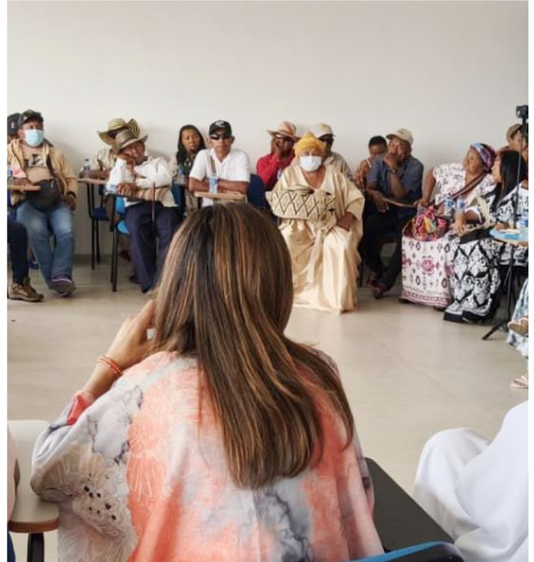
El diálogo institucional permitió transformar el cierre del territorio ancestral en una ruta de conversación y trámite legal.