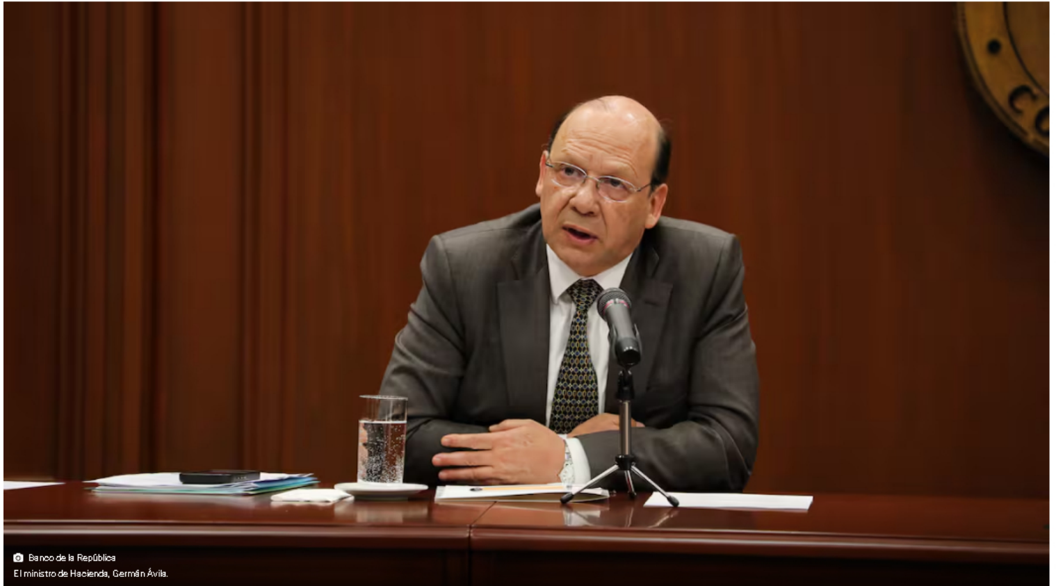
Banco de la República El ministro de Hacienda, Germán Ávila.