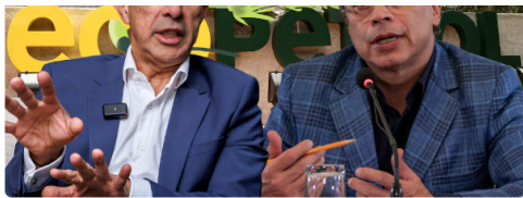
Gustavo Petro habla hablando de posibles cambios en la junta directiva de Ecopetrol tras apartar a Ricardo Roa de la petrolera.