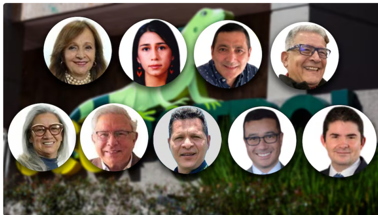
La junta directiva de Ecopetrol tendrá cambios tras tensiones entre sus partes y el accionista mayoritario.