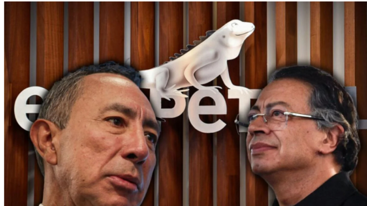
La relación entre el presidente y Roa está rota.

El Gobierno convocará a una asamblea extraordinaria de accionistas de Ecopetrol mientras continúan las diferencias con la junta directiva y las reacciones por la situación del presidente de la compañía.